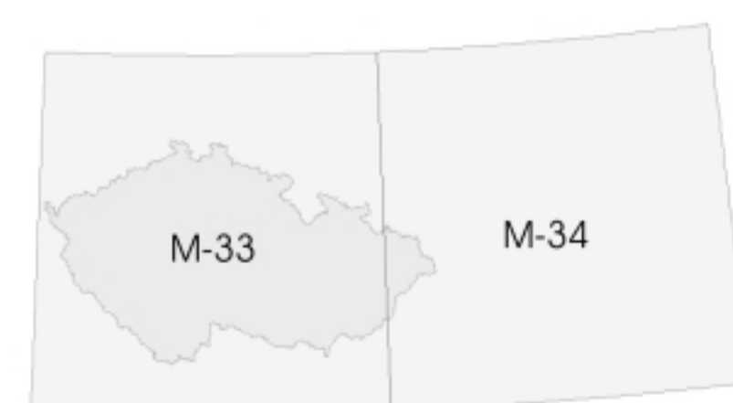
Obr.4. Ukázka kladu listů map 1:1M souřadnicového systému S42.

1:25 000: M-33-14-A-a, M-33-14-A-b, M-33-14-A-c, M-33-14-A-d , (viz obr. 3.),